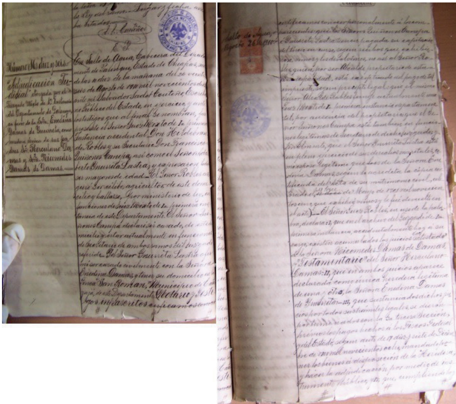
Imagen 1. Fotografía del documento original de la Herencia de Enedina Damas de Ynurreta, hija de Herculano Damas y Nicomedes Damas de Damas