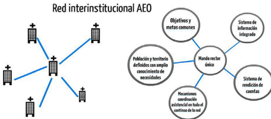
Figura 1. Propuesta de red para la AEO