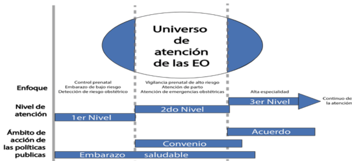
Figura 2. Atención de las emergencias obstétricas en México