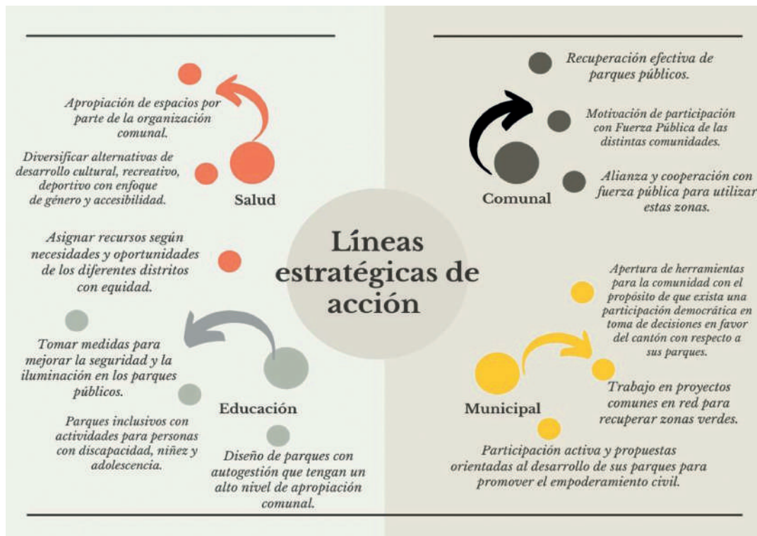
Imagen 1. Líneas estratégicas de acción