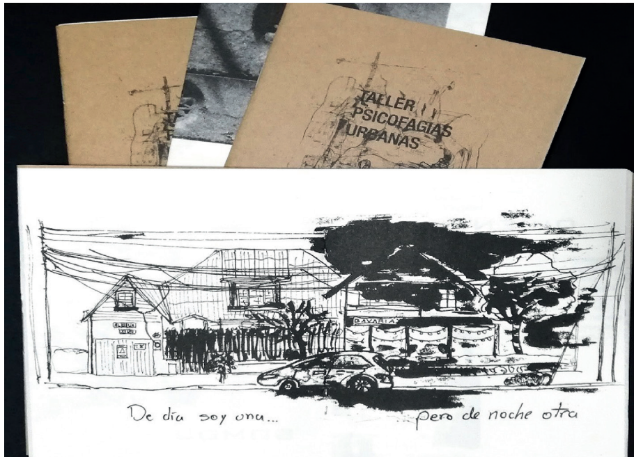
Imagen 9. Fanzine elaborado con los resultados de los participantes del taller “Psicofagias urbanas”, Centro Cultural de España, Barrio Escalante