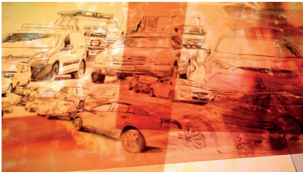
Imagen 8. Detalle de una instalación de la exposición “Opacidades de una calle excesivamente luminosa”

Sobreposición de fotografías y dibujos sobre una mesa de luz, como interpretación de la densidad lumínica y de tráfico en Barrio Escalante.