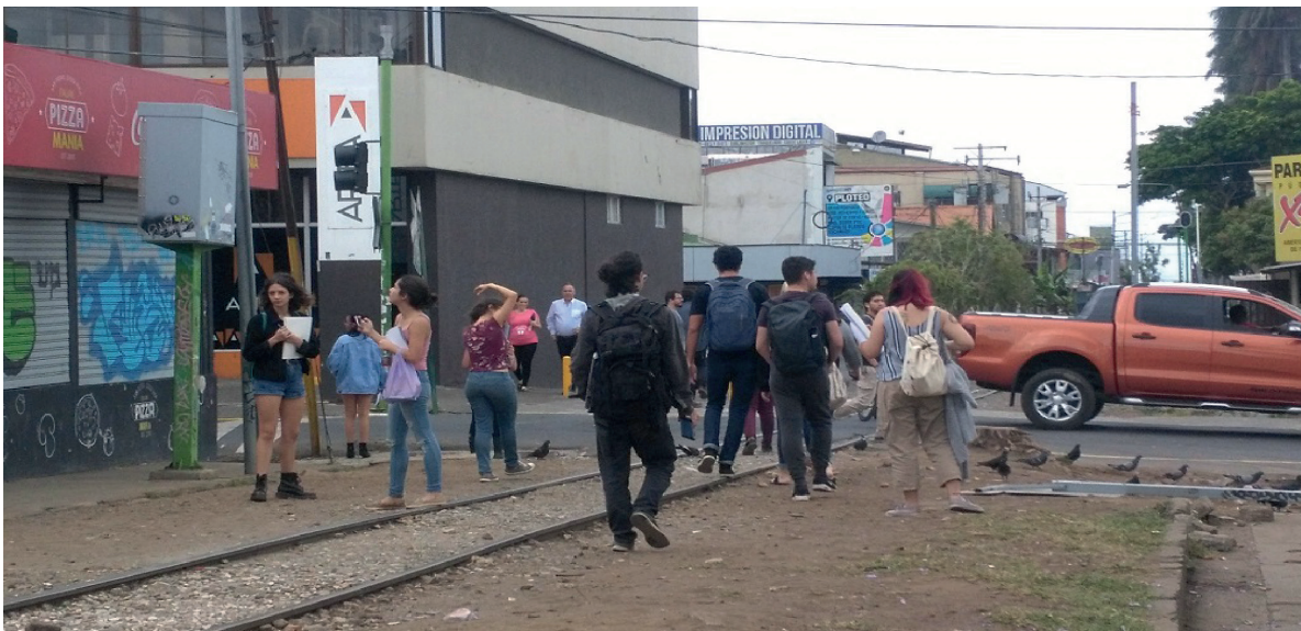
Imagen 10. Caminata masiva en San Pedro siguiendo la línea del tren, con los participantes del taller “Psicofagias urbanas”, junio de 2019