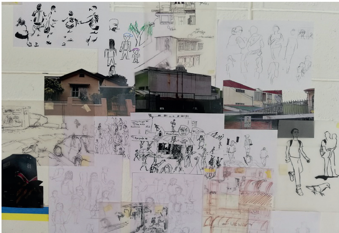
Imagen 11. Detalle del montaje de dibujos y fotografías en la galería de la Escuela de Artes Plásticas de la Universidad de Costa Rica, sede Rodrigo Facio, San Pedro, junio de 2019

Los participantes del taller se encargaron de hacer el montaje colectivo a partir de las categorías discutidas.