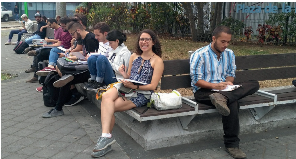
Imagen 2. Ejercicios de dibujo y escucha en San Pedro, frente a la Universidad de Costa Rica, durante el taller “Psicofagias urbanas” impartido en la Escuela de Artes Plásticas, junio de 2019