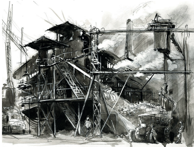
Imagen 4. Dibujo del ingenio de caña de azúcar El Atirro, Turrialba