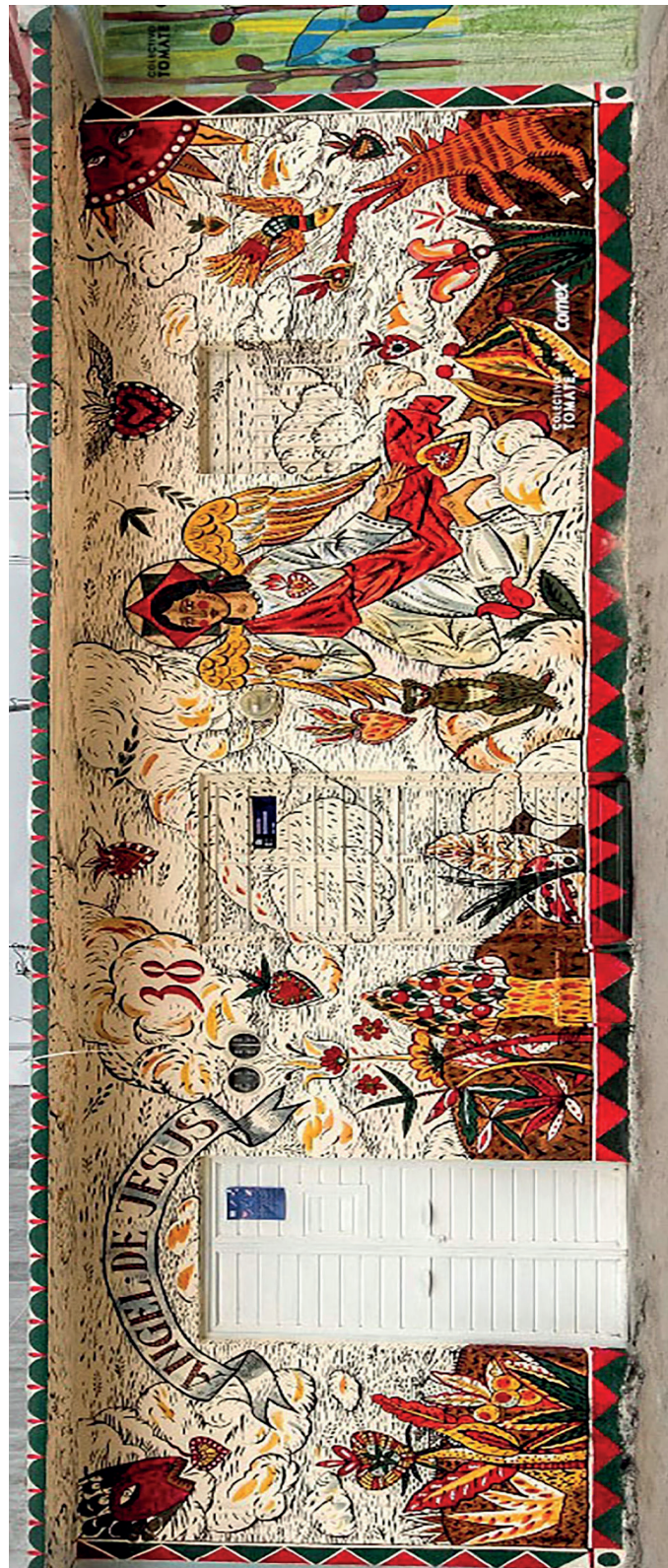
Imagen 2. Mural pintado en el barrio de San Ramón, en el marco del proyecto Ciudades Murales llevado a cabo del 22 de septiembre al 9 de octubre de 2018

Creadora: Yulia Akh, "Ángel de Jesús", acrílico sobre muro, 2018.