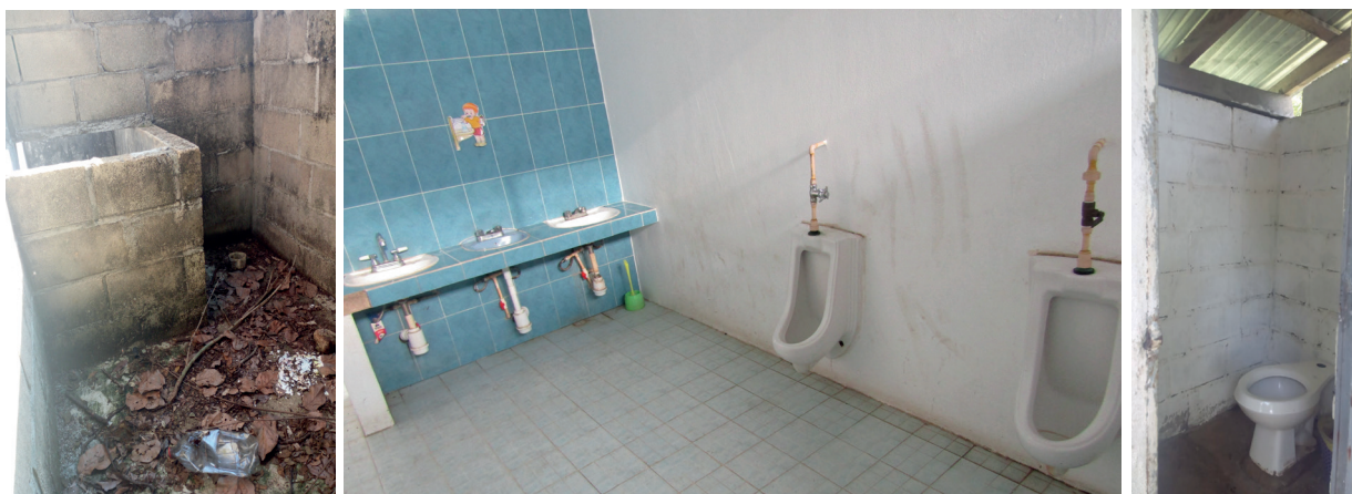
Figura 2. Instalaciones de sanitarios en tres centros preescolares de la zona costa

Sanitarios de tres sitios distintos: un preescolar unitario (P6), un CENDI (CE52) y un preescolar de CONAFE (CI4).