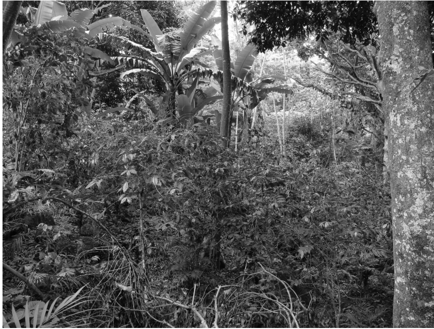
Foto 1. Cafetal cultivado de la barranca, situada al este de Chavarrillo

Fuente: Virginie Thiébaud, 28 de junio de 2015.