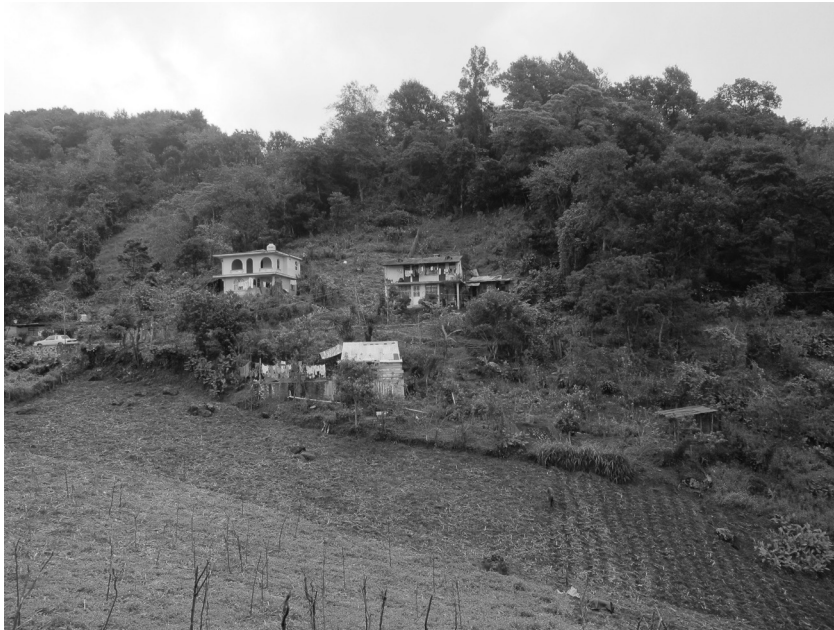
Foto 2. Combinación de varias actividades agrícolas alrededor de casas habitacionales construidas en una parcela ejidal de Tlalnahuayocan

Fuente: Virginie Thiébaud, 8 de diciembre de 2015.