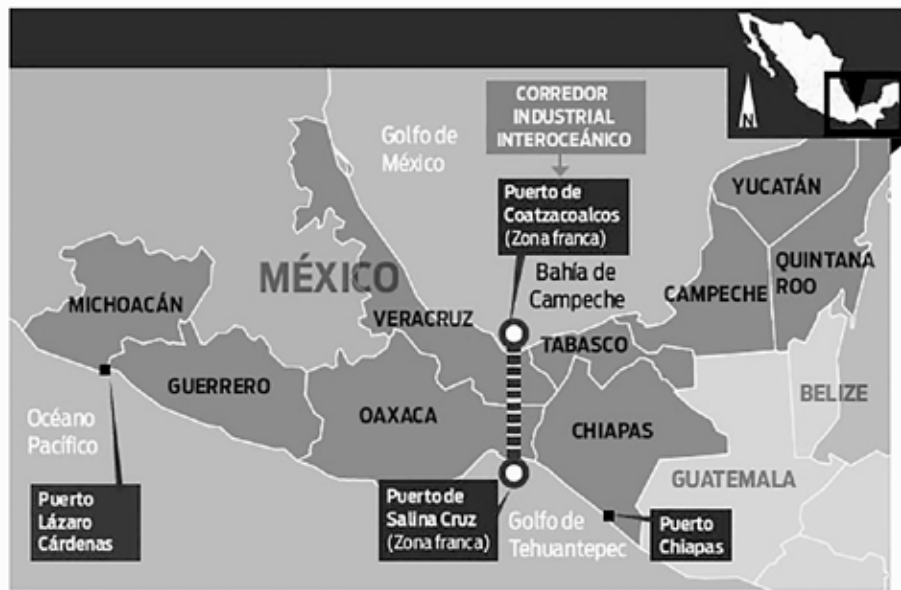
Mapa 1. Ubicación de Puerto Chiapas