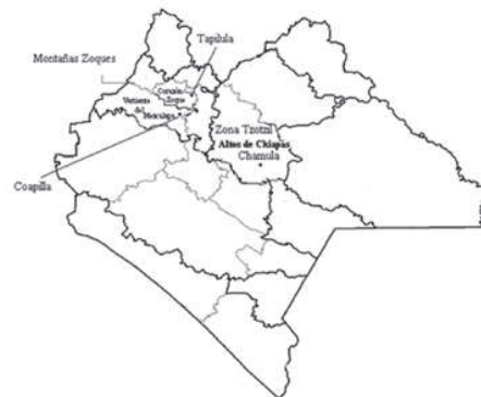
Mapa 1. Regiones Altos de Chiapas, Vertiente del Mezcalapa y Corazón Zoque

Los Altos de Chiapas —que en un sentido amplio abarca todos los municipios localizados en la franja meridional del macizo central, desde Zinacantán, San Cristóbal, Teopisca y Amatenango, en el sur, hasta los límites de ese conjunto montañoso con Tabasco, en el norte— era en el siglo XIX, como en la actualidad, la zona más poblada del estado y en donde habitaba el grueso de la población indígena. Esta circunstancia y el hecho de que una parte importante de las tierras de la región, sobre todo las que se localizan al sur, son terrenos poco propicios para la agricultura, definieron desde entonces la principal vocación de la zona: suministrar de mano de obra barata a otras regiones del estado poco pobladas, pero en donde el sistema de fincas se expandió considerablemente, sobre todo a partir del último tercio del siglo XIX, cuando la agricultura comercial en todo el estado cobró un fuerte impulso.