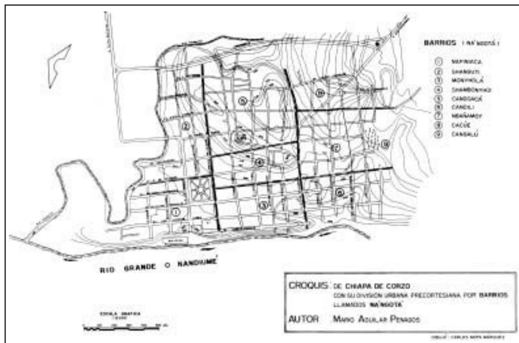
Mapa 2 Chiapa de Corzo, Chiapas