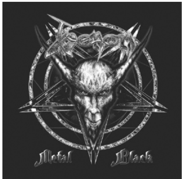
Figura 3. El Black metal: entre lo sobrenatural y la condición humana