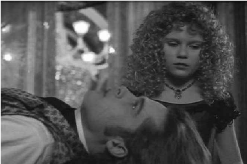
Figura 4. Vampiros metrosexualizados