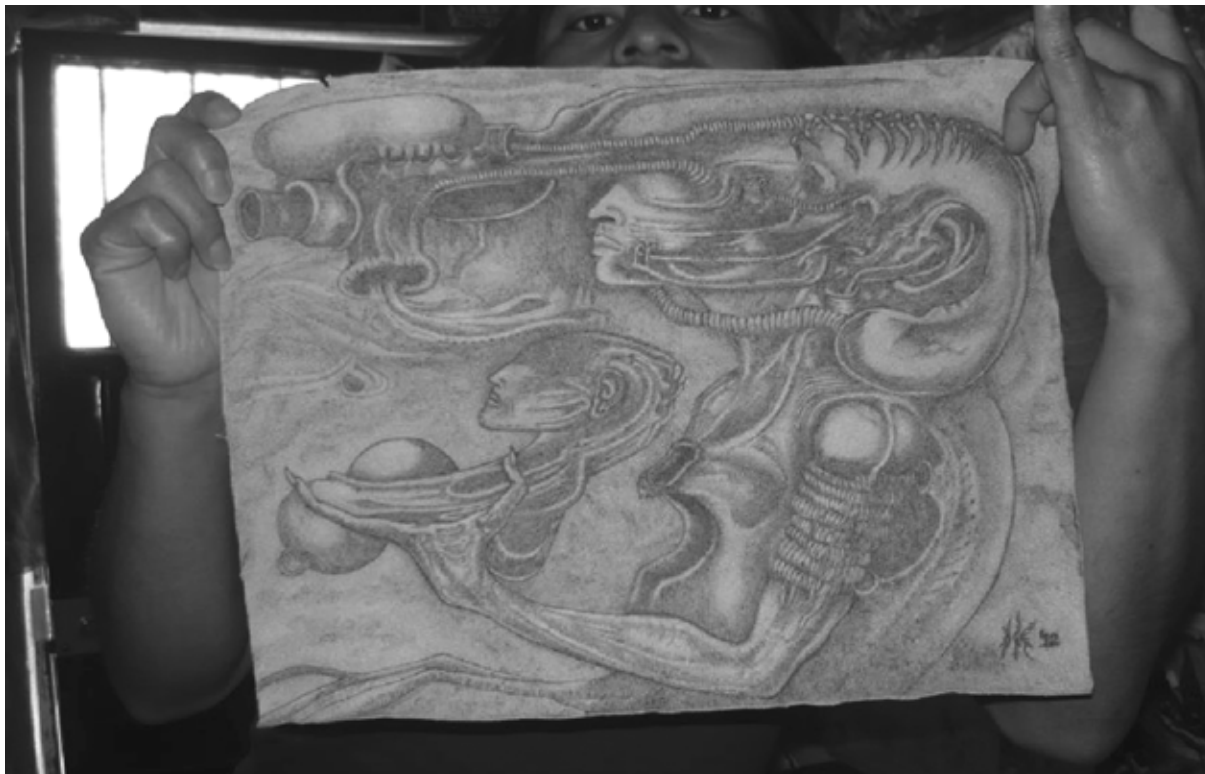
Figura 1. Onésimo Guzmán Arias: Arte oscuro