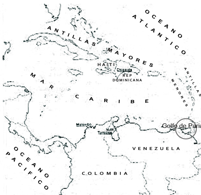
Mapa 1. Ubicación del Golfo de Paria en el extremo oriental de Venezuela